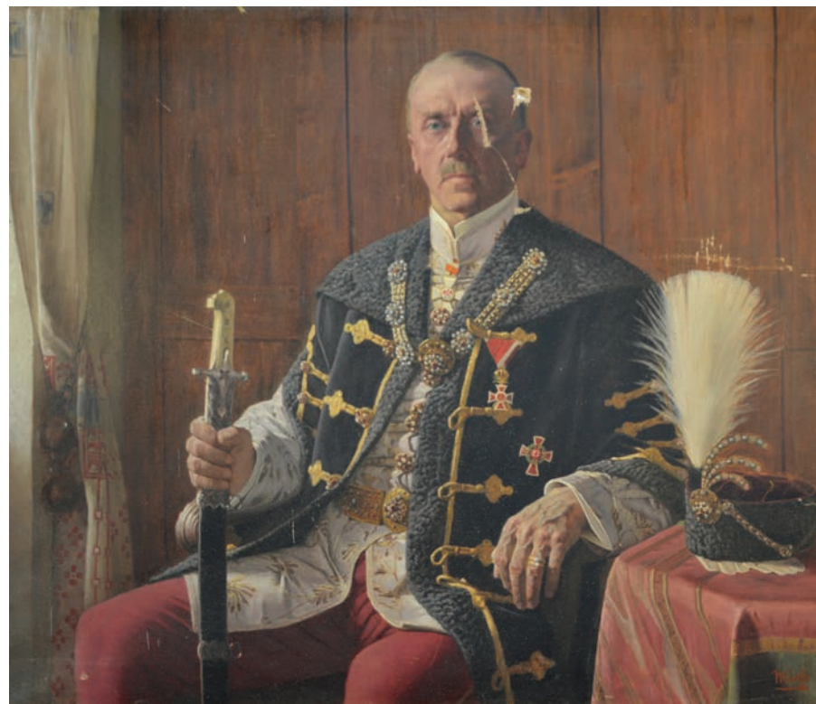
ÎNAINTE DE RESTAURARE

Friedrich Miess a realizat numeroase portrete oficiale. Printre acestea se numără și Portretul lui Ottokar von Czernin , diplomat și politician austriac, care a îndeplinit funcția de ministru de externe al Austro-Ungariei în timpul Primului Război Mondial, în perioada decembrie 1916 - aprilie 1918. Anterior, între 1913-1916, a fost ambasadorul Austro-Ungariei la București. Modelul este reprezentat obiectiv, detaliile fiind notate cu o precizie aproape „fotografică”. Clariitatea elegantă și sobră a compoziției, cromatică reținută, desenul exact ilustrează calitățile prin care s-a remarcat portretistica sa. (RP)