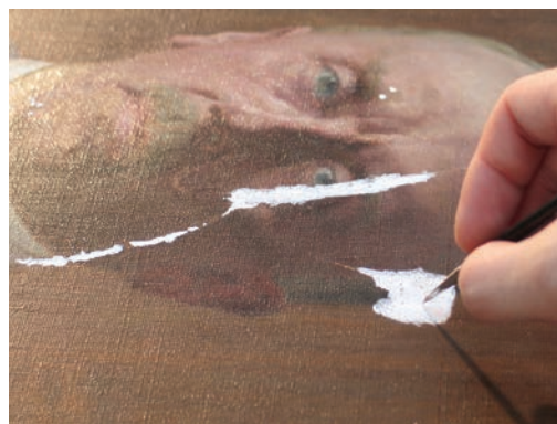
Chituire prin pensulare