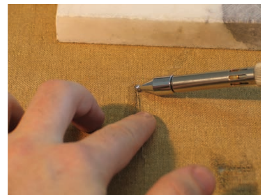
Aplicarea punților de fire